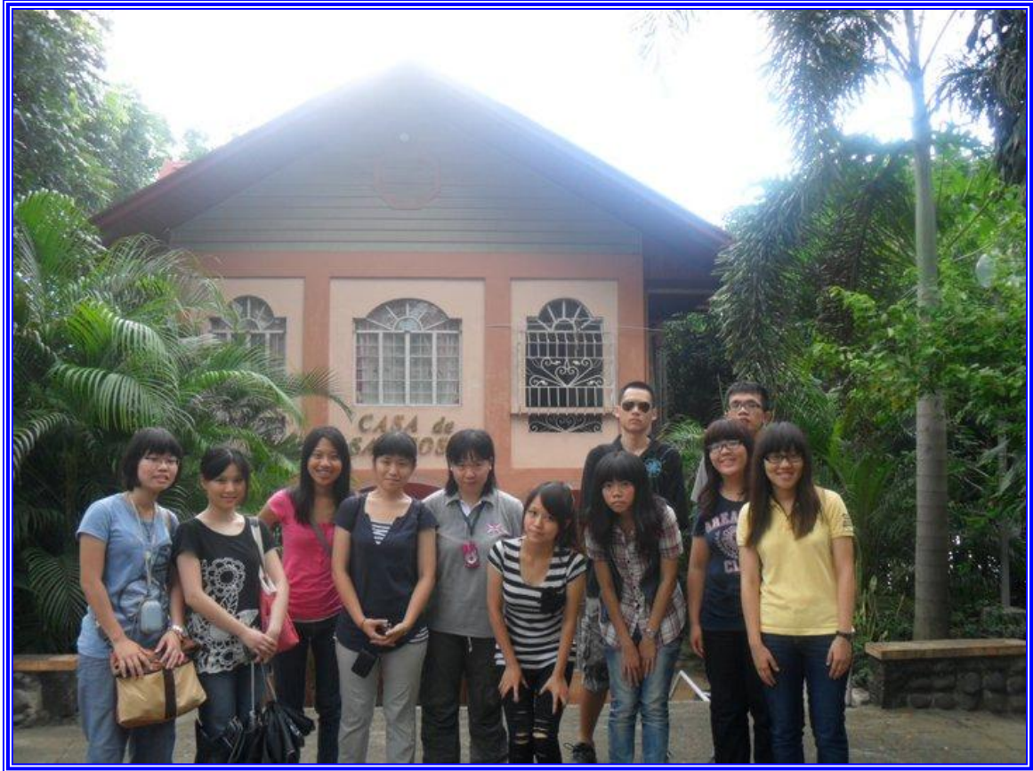
2011 Fu Jen Catholic University English Department Service Learning Project